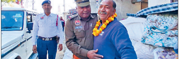
भिवानी। बाहर सामान रखने वाले दुकानदार को माला पहनाते पुलिस अधिकारी।