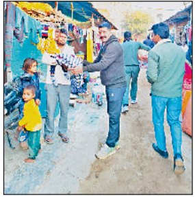
नारनौल। कबल वितरित करते रोटररी क्लब रॉयल्स के सदस्य।