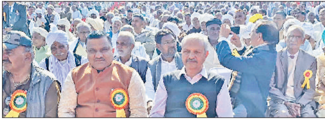
चरखी दादरी। आयोजित कार्यक्रम में उपस्थित गणमान्य लोग।