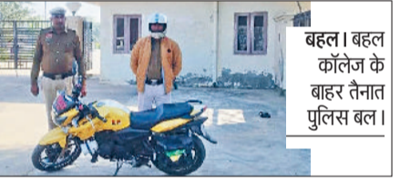
बहल। बहल कॉलेज के बाहर तैनात पुलिस बल।

बहल। राजकीय महिला महाविद्यालय के बाहर आवारागर्दी करने वाले मनचलों की अब खेर नहीं होगी। महाविद्यालय के समय ऐसे मनचलों से निपटने के लिए पुलिस राइडर की तैनाती की गई है जो कॉलेज समय के दौरान और कॉलेज में आने जाने वाली छात्राओं की सुरक्षा सुनिश्चित करेगी। पुलिस को इस पहल का कर्ब और बहल क्षेत्र के लोगों ने स्वागत किया है।