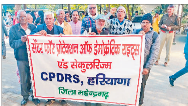
नारनौल। लघु सचिवालय में प्रदर्शन करते संगठनों के सदस्य तथा बैठक के दौरान संघ के पदाधिकारी।

धर्मनिरपेक्षता हमारे संविधान की मूल निरपेक्षता है, सरकारें लगातार धर्मनिरपेक्षता की अवधारणा को कमजोर करती आ रही है। जिससे भारत की बहुलतावादी संस्कृति खतरे में है।